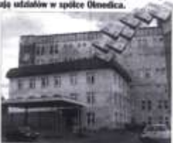
Planiska z bud i od samorządów na modernizację i wyposażenie obciążonego szpitala potrzebne strażniczek