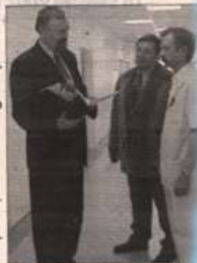
Starosta i ordynator oddziału rozmawiają z wykonawcą.