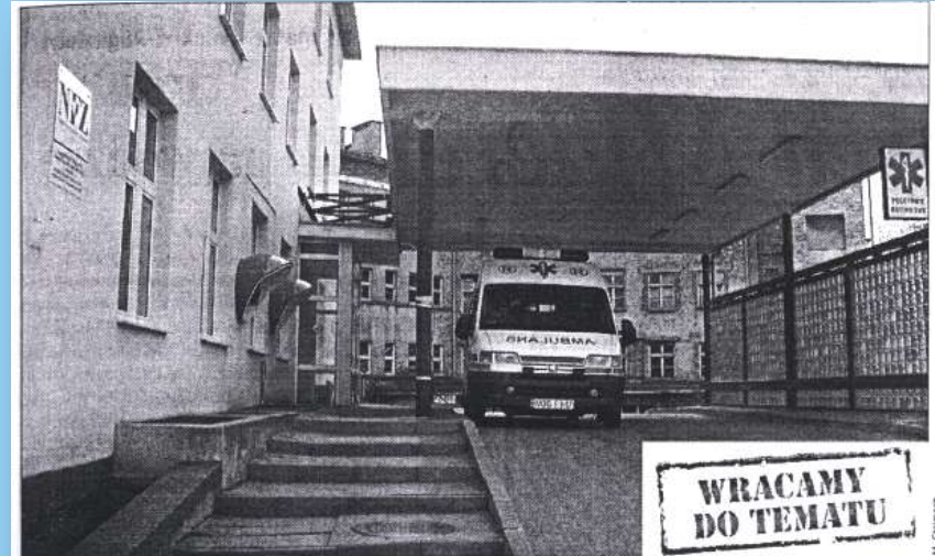
Olecki szpital stoi u progu restrukturyzacji

Radni powiatowi jednogłośnie przyjmują uchwałę w sprawie powołania spółki prawa handlowego. Przejmie ona prowadzenie szpitala, kiedy SPZOZ zostanie pozostawiony w stan likwidacji. Placówka zacznie działalność bez długów, a ich spłacanie weźmie na siebie powiat.